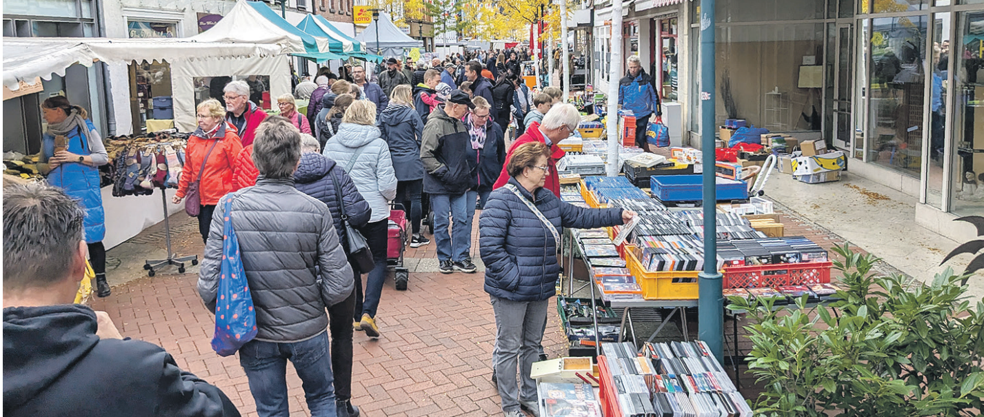
Man kam sich nahe in der Fußgängerzone. Es war zwar noch ein Durchkommen, aber der Goldene Oktober lockte die Menschen in Scharen in die Innenstadt.

Sarstedt (stb). Man wünschte sich, die Sarstedter Fußgängerzone wäre an einem x-beliebigen Wochentag mal so gut besucht wie an diesem letzten Sonntag im Oktober, als die Gemeinschaft Handel und Gewerbe GHG wieder ihren „Goldenen Oktober“ in der achten Auflage veranstaltete. Gut gelaunt strömten die Menschen am frühen Nachmittag in die Innenstadt und erwarteten – und das nicht vergeblich – einen bunten,